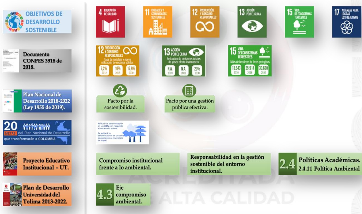
Figura 2. Principales retos a nivel institucional, nacional e internacional en los que se articula la Política Ambiental de la Universidad del Tolima.

De igual forma, la Política Ambiental se articula bien como la Dimensión 3: Responsabilidades, porque en esta se dispone toda la capacidad institucional al servicio de uso y manejo sostenible de todas las áreas en donde la Universidad del Tolima tiene influencia.