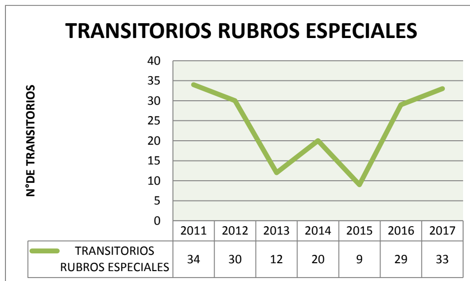
Gráfico 2. Comportamientos históricos transitorios contratados por rubros especiales años 2011 al 2017.

Fecha de corte: Mayo de 2017