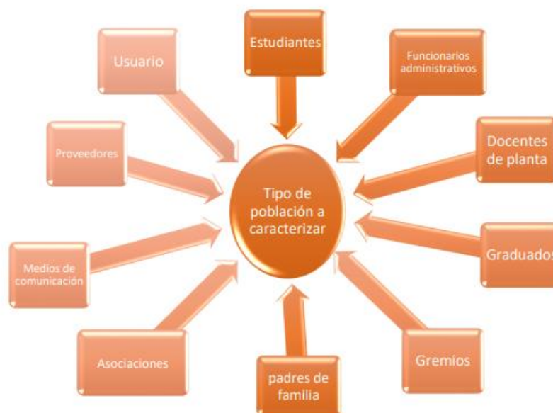
Ilustración 1. Población Total a caracterizar, asumiendo grupos de valor y de interés.

Grupos de Valor: Son aquellos grupos que hacen parte directa e interna de la institución, dando aportes significativos a su funcionalidad y persistencia; viéndose afectado o beneficiados por modificaciones, acciones o actividades realizadas por la universidad: